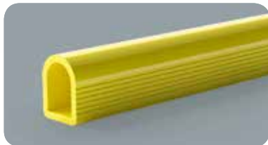
HOLMEN 150 2000

Länge 2000 mm VPE gewünschte Anzahl Farbe M