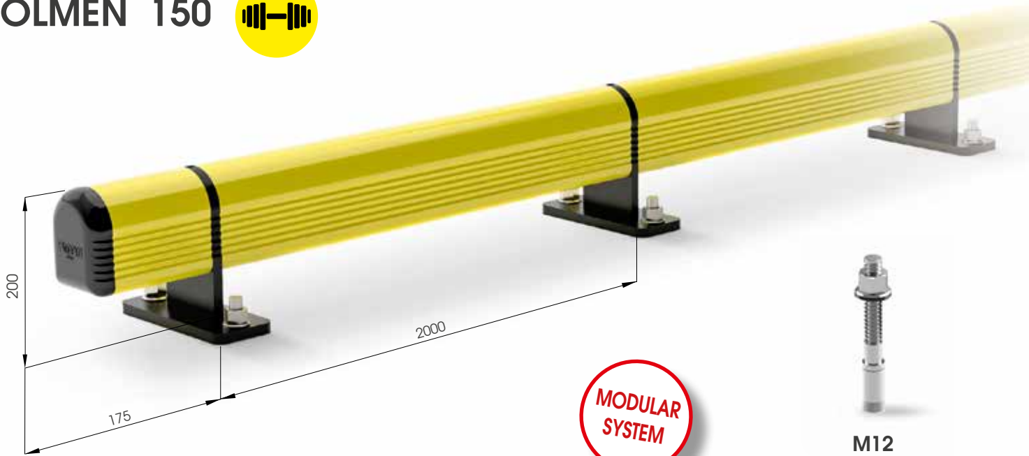
M12 VERZINKTER STAHL